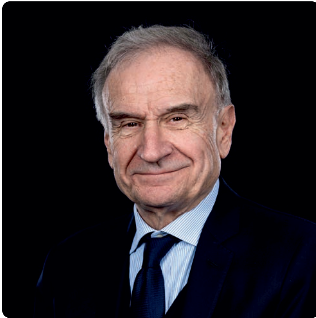
Giovanni Petrucci Presidente FIP

E' con grande orgoglio e profonda soddisfazione che il Comitato Regionale FIP Sicilia rivolge il proprio saluto a tutte le società, agli atleti, ai tecnici, agli arbitri, ai dirigenti e agli appassionati che partecipano alle Finali Nazionali Under 19 Gold, prestigiosa manifestazione che quest'anno trova accoglienza nella splendida città di Piazza Armerina.