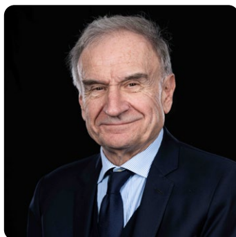
Giovanni Petrucci Presidente FIP

Le Finali Nazionali sono un network, una rete di agonismo (e non di antagonismo), di valori e di possibilità di crescita personale, tecnica e sociale per i ragazzi e le ragazze partecipanti. Quelle attuali sono il risultato del lavoro di tanti anni da parte di tecnici, di consiglieri e di dirigenti federali, così come dei tanti organizzatori locali, che hanno aggiunto, di volta in volta, impegno, serietà, professionalità, consentendoci di offrire un prodotto performante in ogni punto del network, nelle diverse città d'Italia. Un network che è stato premiato con la presenza di un nuovo partner, con cui la FIP condivide già, per il settore minibasket, i valori di un'alimentazione bilanciata e uno stile di vita attivo, supportando al contempo iniziative che favoriscano la diffusione della pallacanestro sul territorio. Kellanova, azienda leader a livello