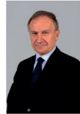
Giovanni Petrucci Presidente Federazione Italiana Pallacanestro

Le Finali Nazionali Giovanili, ogni anno sempre più, dimostrano la vitalità e la bontà del nostro movimento. È la seconda edizione dal post pandemia e, quasi a voler recuperare il tempo perduto, avverto molto entusiasmo, piacere di stare insieme, voglia di competere e di vincere, nel rispetto delle regole. Le Finali Nazionali assegnano uno scudetto, completano il percorso agonistico di una stagione e capisco come nessuno voglia arretrare di un centimetro in gara, come si suol dire. Il tratto caratterizzante ed educativo, però, è la lealtà e il rispetto delle regole che caratterizzano lo sport, che qualificano la pallacanestro.