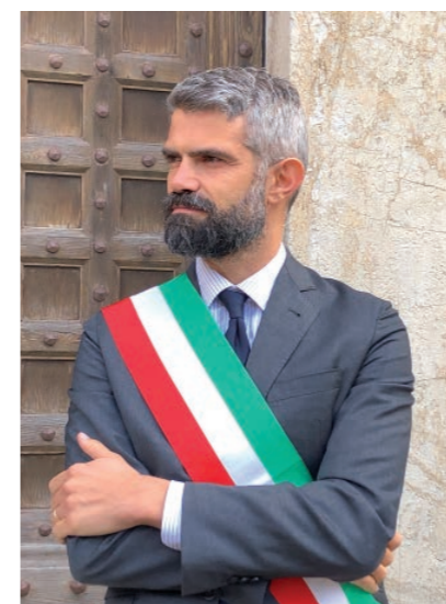
Francesco Ferrari Sindaco di Piombino

È con grande orgoglio che ci accingiamo ad accogliere la fase finale del campionato nazionale under 17 eccellenza di pallacanestro, un torneo che assegnerà, cosa mai successa nella nostra città, uno scudetto di campione d'Italia.